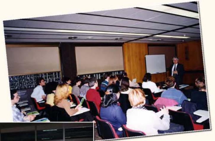
Conferencia en la Clínica del Pilar