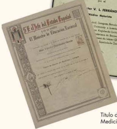
Título de Doctor en Medicina y Cirugía